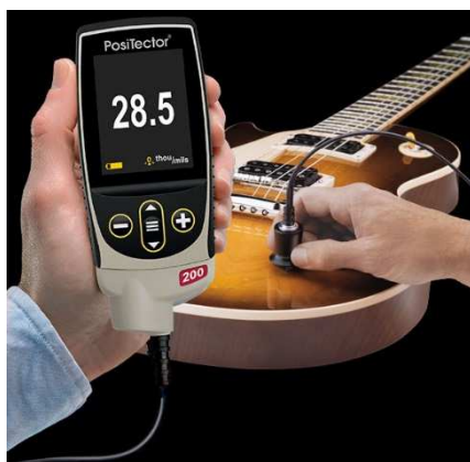
Model Advanced v grafickom režime