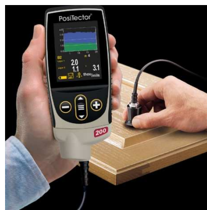
Sonda D je vhodná pro meranie polyurey